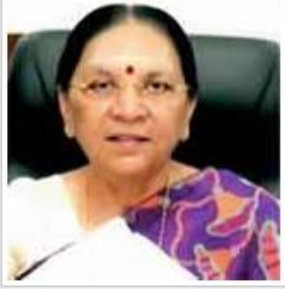
SMT. Anandiben Mafatbhai Patel Chancellor The Hon'ble Governor of Madhya Pradesh