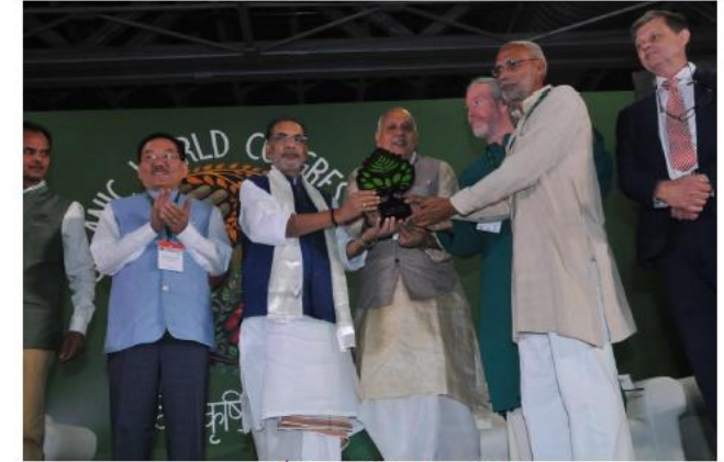
1 st Dharti Mitra Award 2017 By Organic India in Organic World Congress 2017 Greater Noida