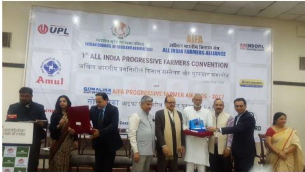
सोनालिका आइफा प्रगतिशील किसान पुरस्कार 2017