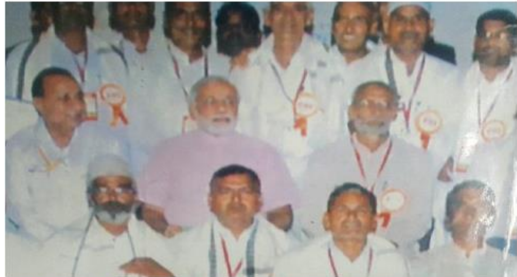
Received Best Developing and Innovative Farmer Award 20 By-C.M. Narendra Modi at Gandhinagar Gujarat.