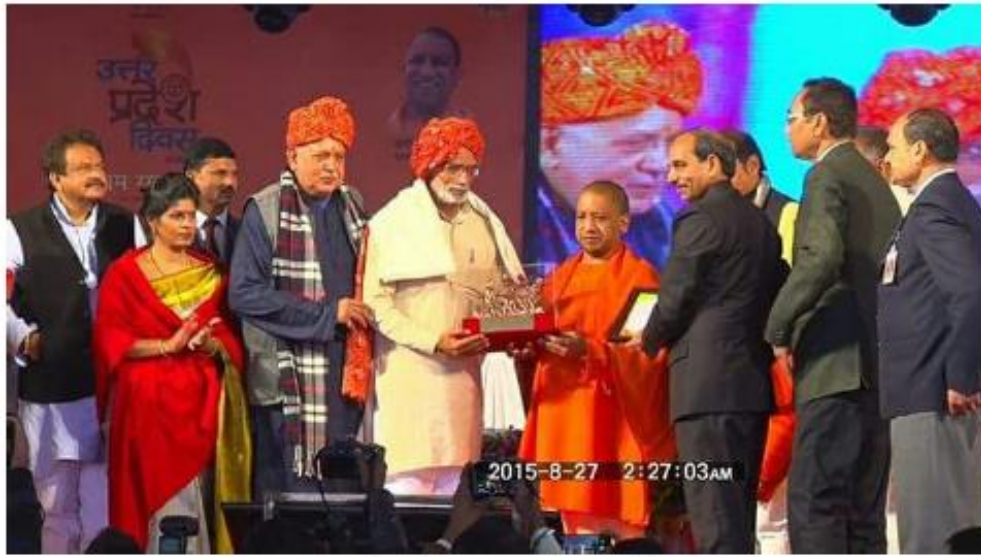
उत्तर प्रदेश विद्युत पर माननीय मुख्यमंत्री उत्तर प्रदेश श्री योगी आदित्यनाथ जी द्वारा सम्मनित